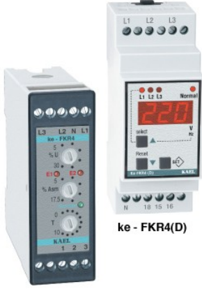
ke - FKR4