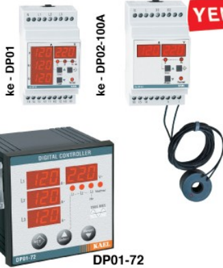
ke - DP01