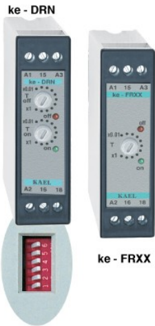
ke - DRN