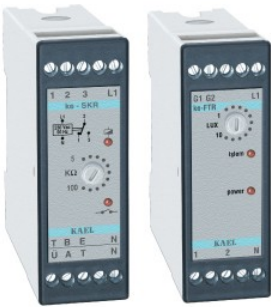
ke - SKR