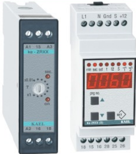
ke - ZRXX