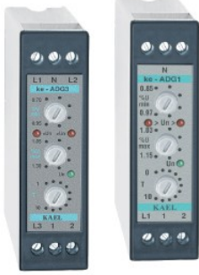
ke - ADG3